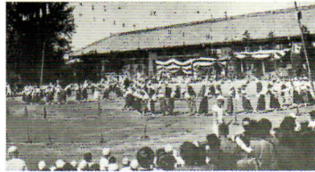
大正時代の運動会