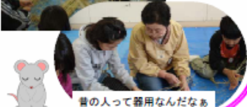
昔の人って器用なんだなあ