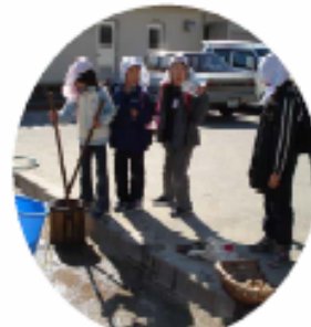
いも洗い、棒を巧みに操って