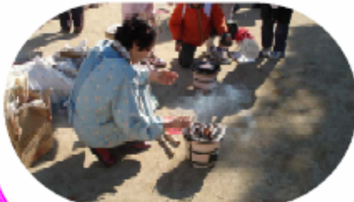
丸干しが焼けていきます。いいかおり！

現在は、どの作業もほとんど機械化されて便利です。でも、この体験を通して、昔の暮らしの大変さを体で知るとともに、この手作業労働から昔の人の知恵を知ることができました。炭火で焼いた鯛の丸干しは、ふだん魚嫌いの子も、おいしいおいしいと言ってまるごとかぶりついていました。大豆をひき臼で挽くと、とても香ばしいかおりが体育館中に広がりました。とても貴重な体験ができました。