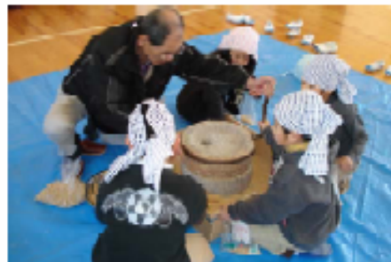
ひきうすで大豆と炒った玄米を挽きました

～道具を通して昔の人の生活の知恵や苦労を学ぼう～ 本校の民具室には昔の米作りの道具や生活用品などが保管されています。その道具を展示して、宮田小支援ボランティアのおじいさん、おばあさんが自分の生活体験をまじえて昔の暮らしについて話をしてくださいました。その後、その道具を実際に使って、洗濯やいも洗い、水汲み、七輪の火おこし、鯛の丸干し焼きなどを体験しました。