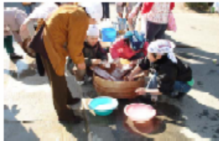
慣れない手つきでお洗濯

～道具を通して昔の人の生活の知恵や苦労を学ぼう～ 本校の民具室には昔の米作りの道具や生活用品などが保管されています。その道具を展示して、宮田小支援ボランティアのおじいさん、おばあさんが自分の生活体験をまじえて昔の暮らしについて話をしてくださいました。その後、その道具を実際に使って、洗濯やいも洗い、水汲み、七輪の火おこし、鯛の丸干し焼きなどを体験しました。