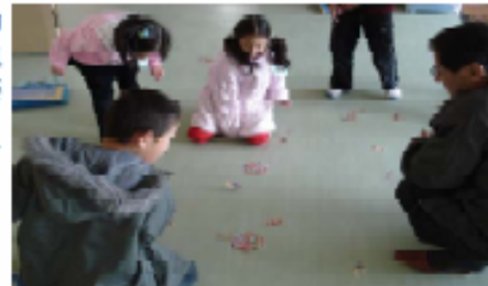
メンコはむずかしいなあ～